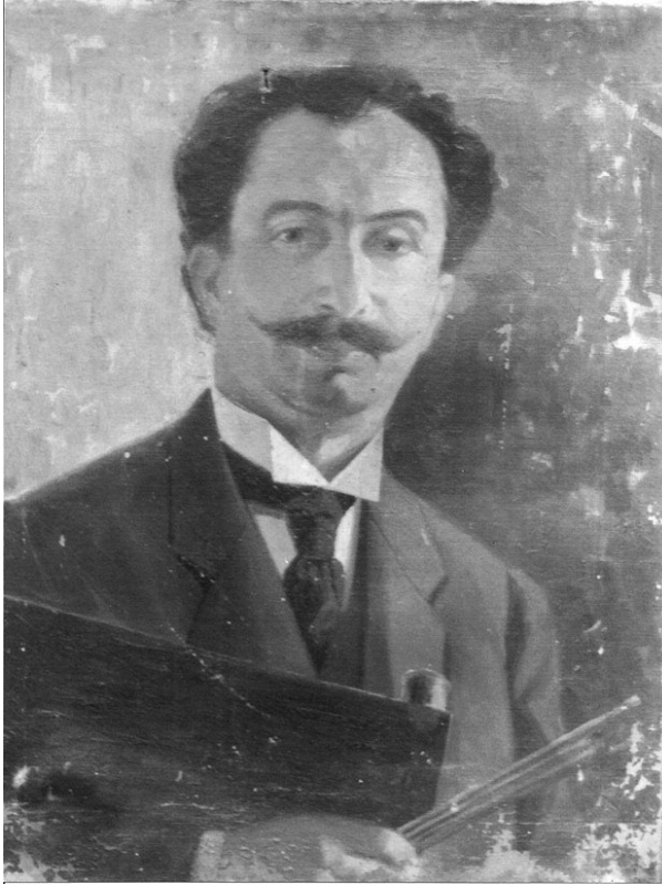
Fig. 1 - Raffaele Vincenzo Barone, Autoritratto da giovane , Barcellona, Galleria Rosabarna

Qualche anno dopo la sua nascita, nel 1865, durante il primo censimento effettuato a Vaccarizzo Albanese 4 dopo L'unità d'Italia, risultavano abitare in via Ospizio, «Barone Lorenzo, pittore di Lago, da 7 anni (1849), Librandi Maria e Raffaele (1863), pituri i Bagliarshit ». Il documento testimonia come Raffaele sia da riferire al nostro pittore, poiché il 1863 coincide con la data rintracciata nell'atto di nascita.