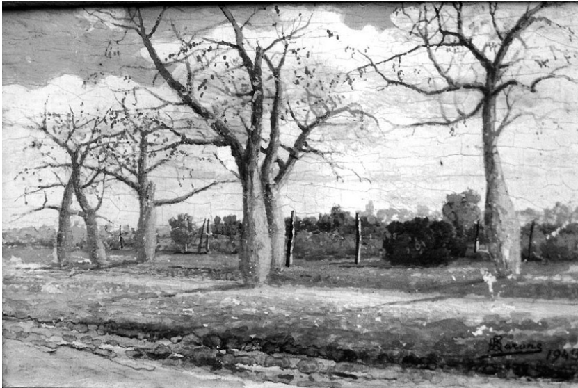
Fig. 4 – Raffaele Vincenzo Barone, Paesaggio con alberi (1943), Barcellona, Galleria Rosabarna

Del tutto inedito, invece, è il dipinto su rame ritrovato in collezione privata a Vaccarizzo Albanese 12 che raffigura San Giovanni evangelista e reca l'iscrizione e la data «Raff. Barone dip. 1883».