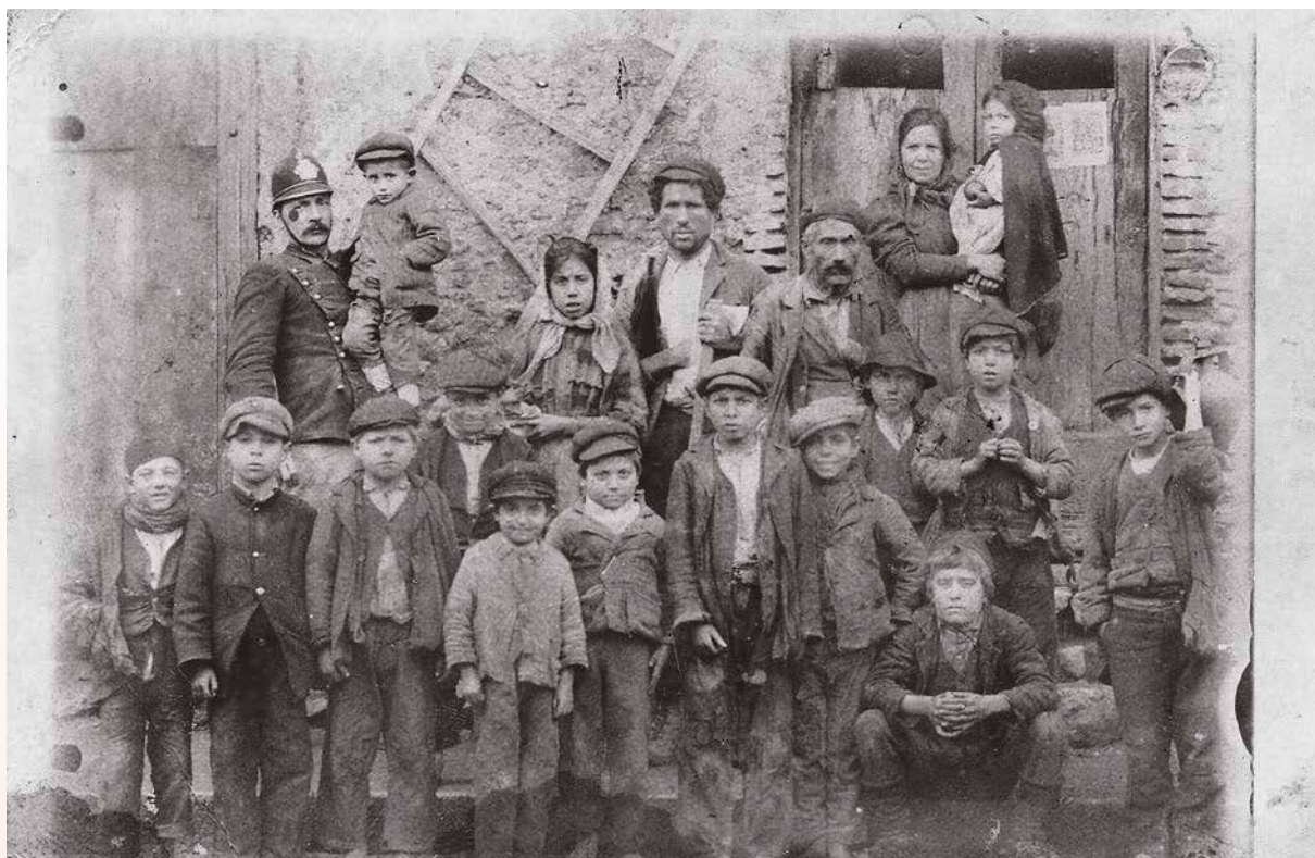
Terremoto di Oppido

“Vingt jours parmi les sinistrés-Naples, Calabre, Sicile” , (Paris 1909). Da tale fatica, di cui abbiamo rintracciato un solo esemplare conservato nella Biblioteca Nazionale di Francia, stralciamo, traducendolo dal francese, quanto di più significativo possa ricavarsi.