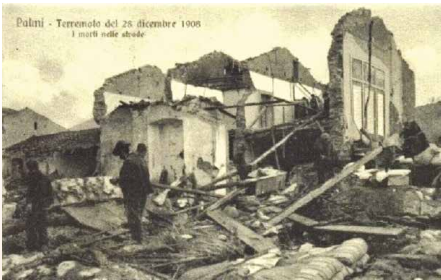
Palmi - Terremoto del 28 dicembre 1908 I morti nelle strade