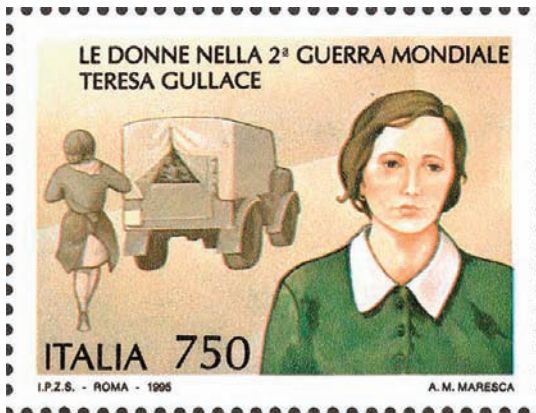
Il francobollo commemorativo dedicato a Teresa Gullace

ancora piena campagna. Di nuovo una sovrapposizione.