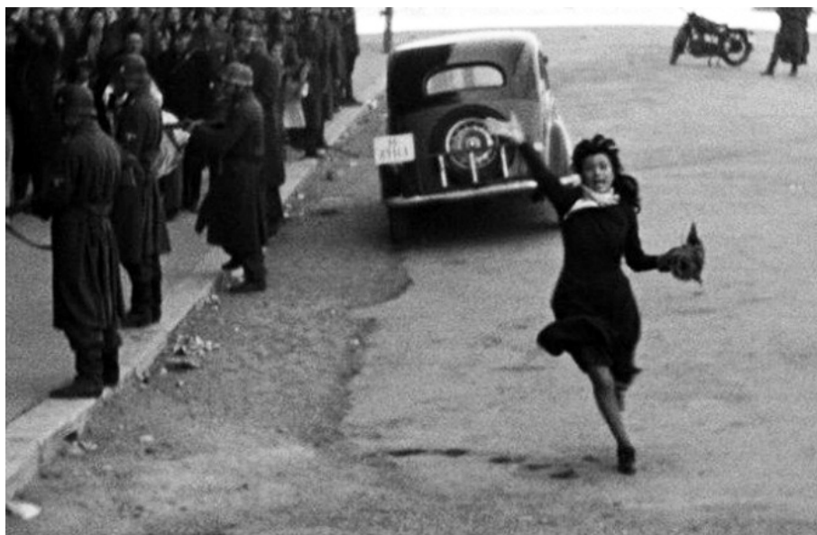
La scena del film di Fellini con Anna Magnani