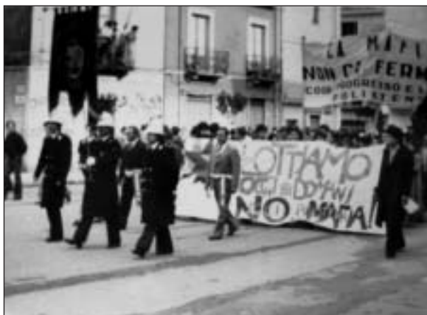
Un momento della manifestazione contro la 'ndrangheta a Gioiosa il 16 aprile del '78.