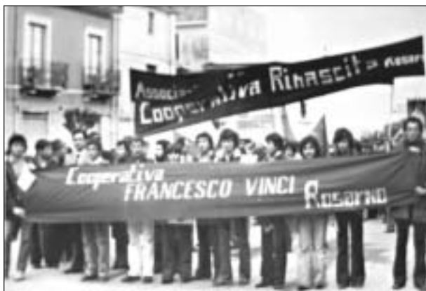
Sfilano anche i ragazzi rosarnesi delle cooperative Ciccio Vinci e Rinascita.