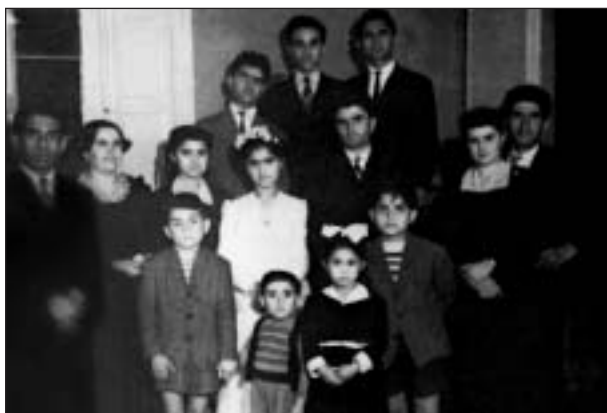
La famiglia Gatto.