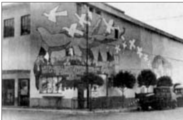
Il murales in piazza Vittorio Veneto a Gioiosa, dipinto dagli artisti milanesi per ricordare Rocco Gatto, in una immagine dell'epoca.